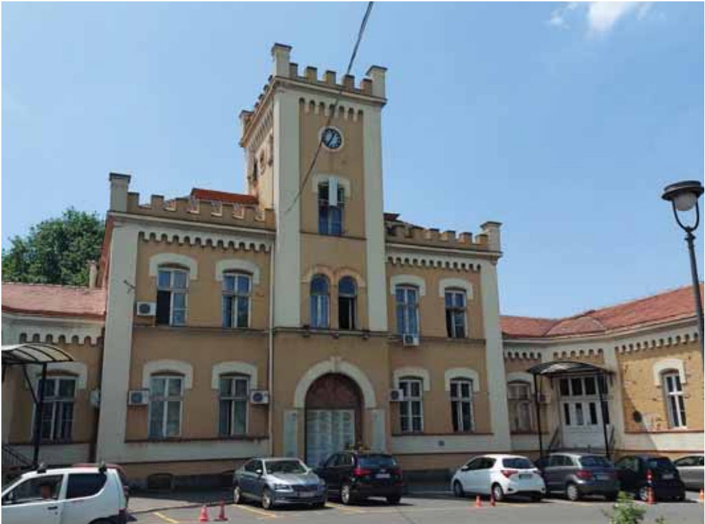
Upravna zgrada Kliničkog centra Srbije.