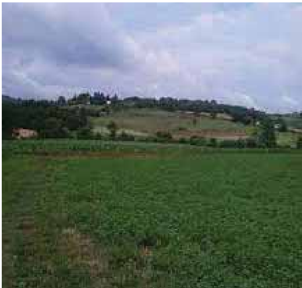
Majkić Japra – pogled na brda.

kao pouku naročito za mlade koji moraju istrajati i biti uporni u životu. Danas sam dobila preko 800 čestitki za rođendan od prijatelja, kolega i mojih bivših studenata. Najtoplije im zahvaljujem na divnim čestitkama i porukama. Smatram da sam svojim radom i znanjem uticala na mnoge mlade ljude koji su danas izvanredni stručnjaci, a pre svega ljudi. Mislim da ne