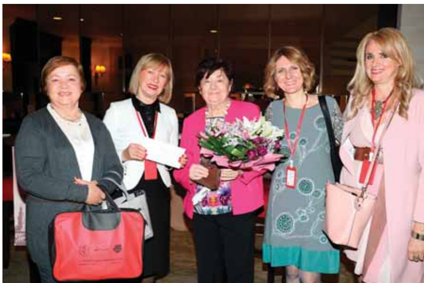
Primam čestitke za rođendan od koleginica (Beograd, april 2019).