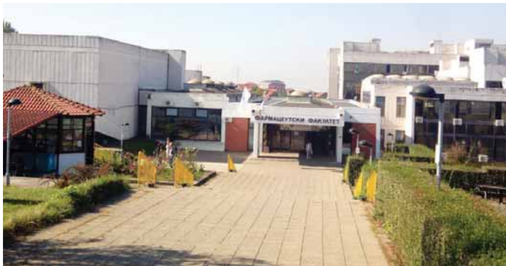
Farmaceutski fakultet Univerziteta u Beogradu.