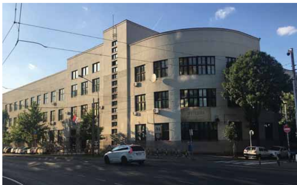
Prva beogradska gimnazija osnovana 1839. godine.