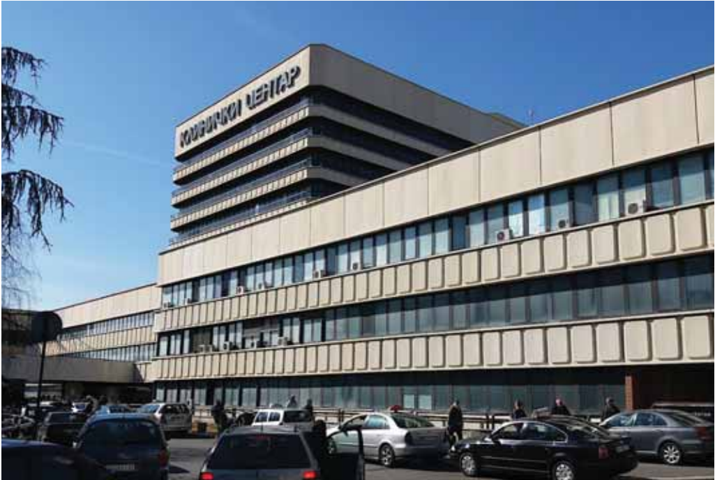
Zgrada Kliničkog centra Srbije u kojoj je bio Institut za medicinsku biohemiju.