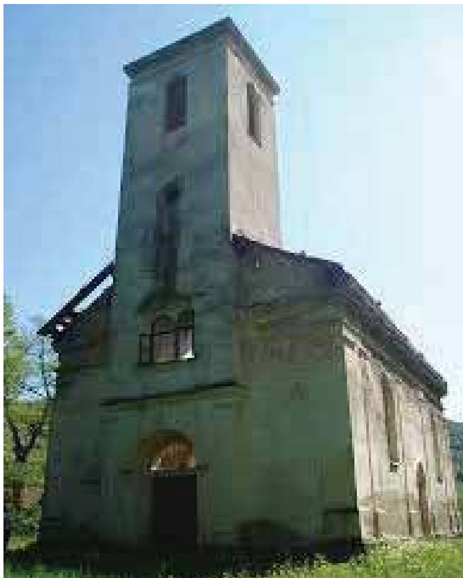
Stara crkva odmah pored škole.

zimi i leti. Naročito sam strahovala kad je trebalo da pređem reku Japru na kojoj se nalazilo kao most neko brvno koje smo zvali „vrljika“.