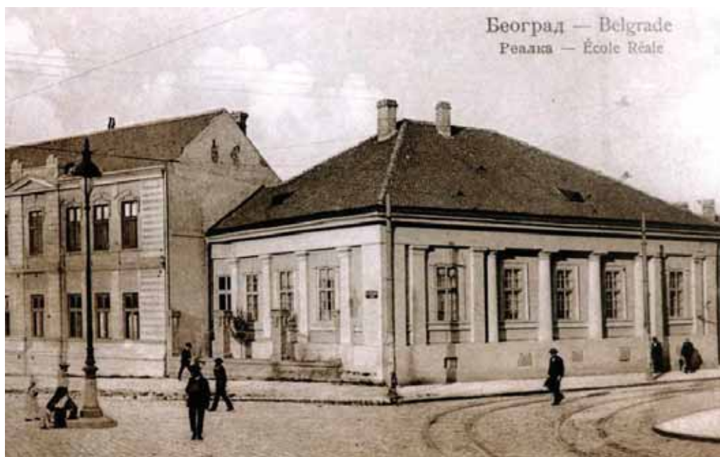
Osnovna škola „Đorđe Jovanović“.

da putujem u Beograd. Gledala sam nebo puno zvezda i osećala se kao kad su Osmanlije odvozile decu iz Srbije u janjičare. To mi je ostalo u trajnom sećanju.