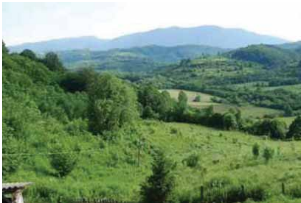
Majkić Japra – pogled na planinu Grmeč.