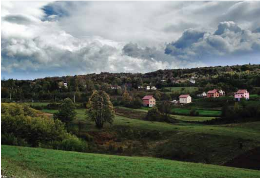
Majkić Japra – pogled na selo.

treba da navodim njihova imena. Oni će se prepoznati, a takođe će i svi dobronamerni ljudi znati o kome se radi. Oni su ti koji opravdavaju sve moje napore i teškoće kroz koje sam godinama prolazila.