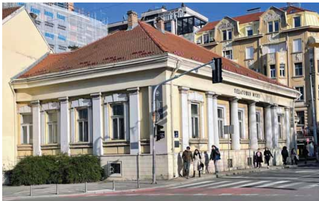
Moja osnovna škola „Đorđe Jovanović“, sada „Pedagoški muzej“.