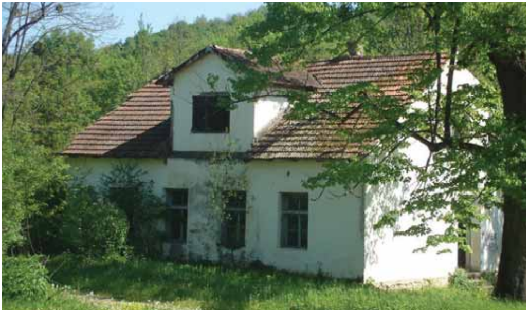
Majkić Japra – moja osnovna škola.

U školu sam pošla sa 6 godina. Do škole koja se nalazila odmah uz crkvu pešačila sam nekoliko kilometara i