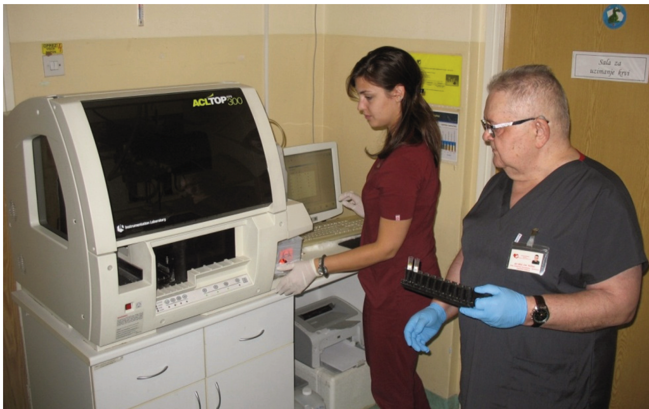
Odsek hematologija-hemostaza Službe za laboratorijsku dijagnostiku 2024. godine.